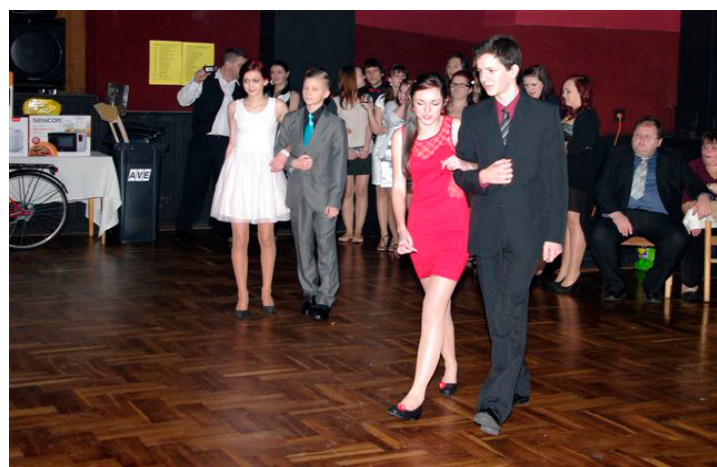
27. 12. 2015 - 9. městský reprezentační ples v KD Strmilov