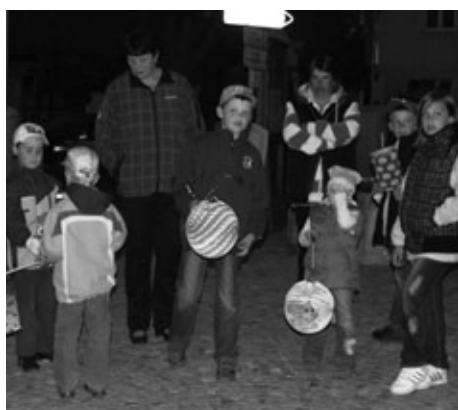
Lampionový průvod 4. 5. 2012