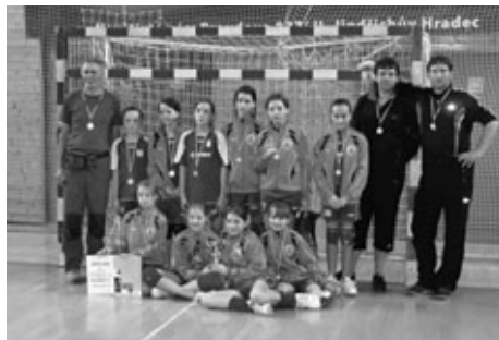
Prague Handball cup 2012