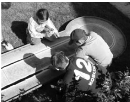
26. 5. 2012 - renovace golfových drah