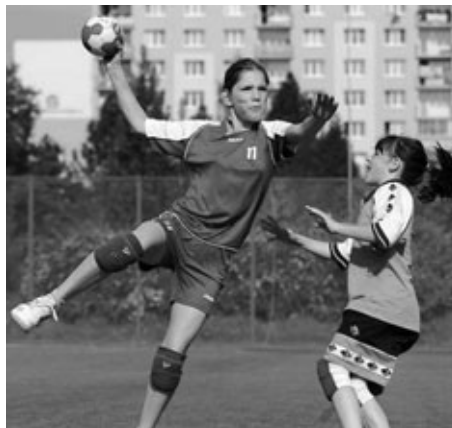
Zapálení pro hru je patrné z každého pohybu

Činnost oddílu je prakticky celoroční a zahrnuje vedle zmiňovaných přípravných turnajů a soutěžních zápasů turnaje přípravky 4+1, pra-