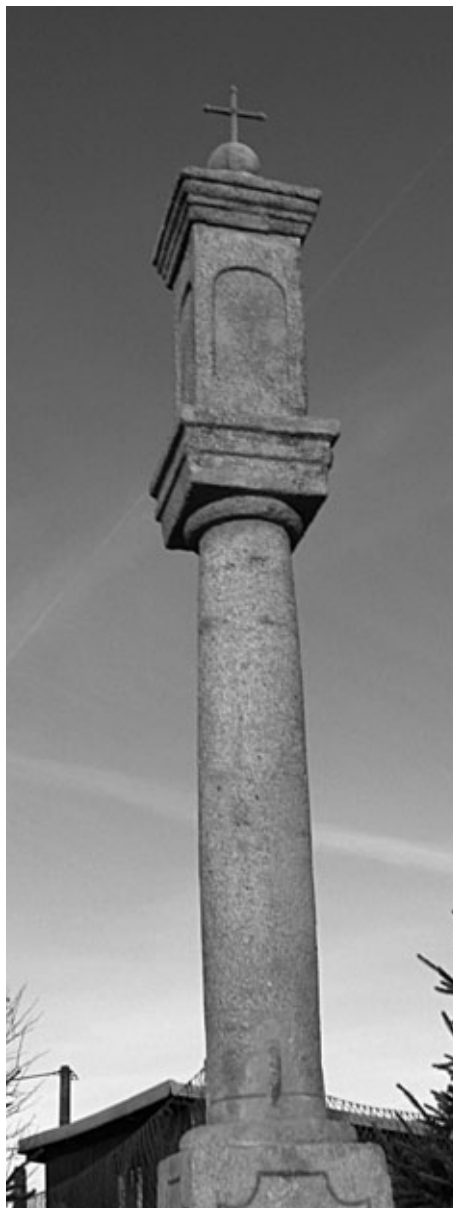
Zrekonstruovaná Boží muka ze 17.století v Hradecké ulici

Profesně spolupracuji nejčastěji s kolegou a vrs- tevníkem Ivanem Tláskem ak.soch. Ve dvou se to lépe táhne.