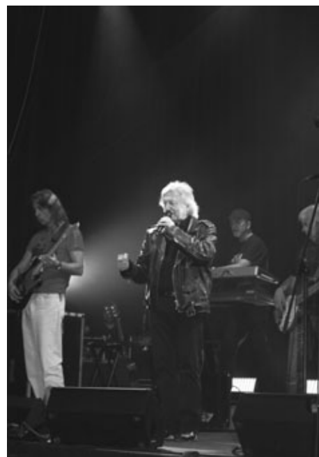
Koncert V. Neckáře 26. 5. 2012 v KD Strmilov