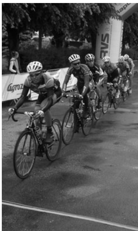
Český pohár 9. 6. 2012 ve Strmilově