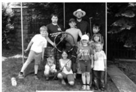
26. 5. 2012 - turnaj v minigolfu