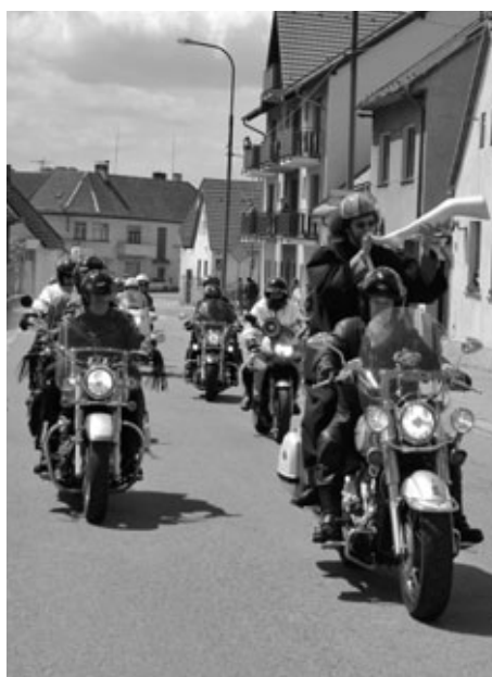
Zahájení motocyklové sezóny ve Strmilově 13. 5. 2012