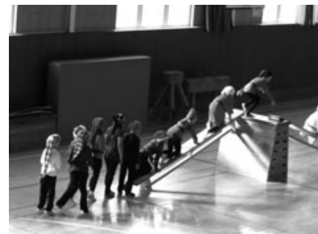
Školní akademie ve sportovní hale 28. 3. 2012

I o prázdninách bude ve škole panovat čilý ruch. Již na konci června začne výměna oken na tzv. staré škole. Bude to nejnáročnější akce prázdnin.