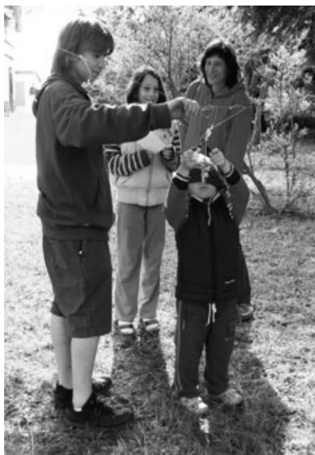
Den matek 13. 5. 2012, farská zahrada