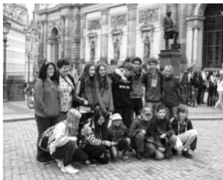
Výlet za hranice všedních dnů 6. 5. 2012