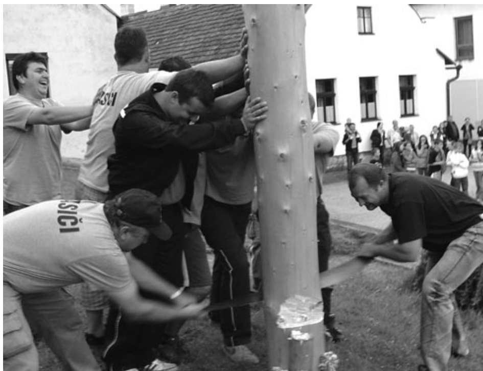
Kácení máje 2. 6. 2012