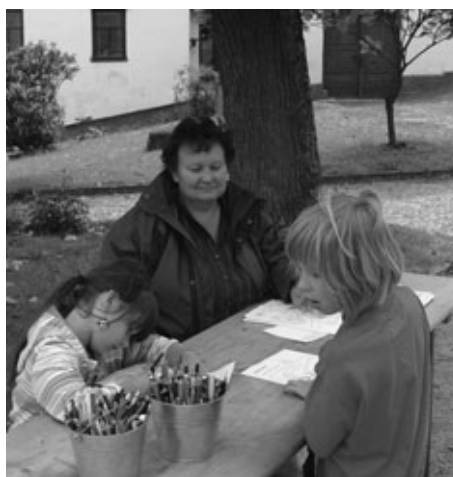
Dětský den 2. 6. 2012