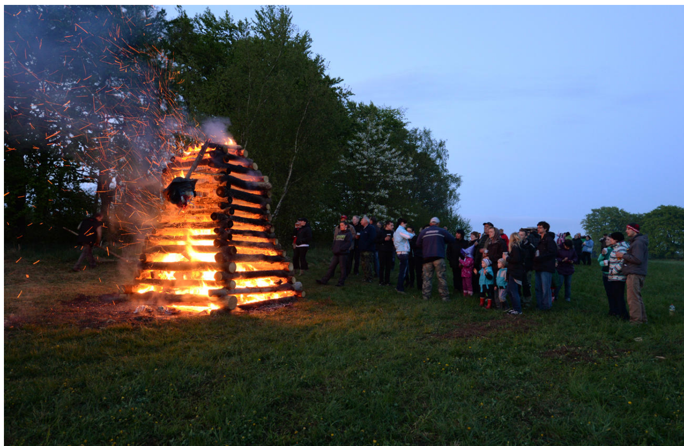
Pálení čarodějnic v České Olešné