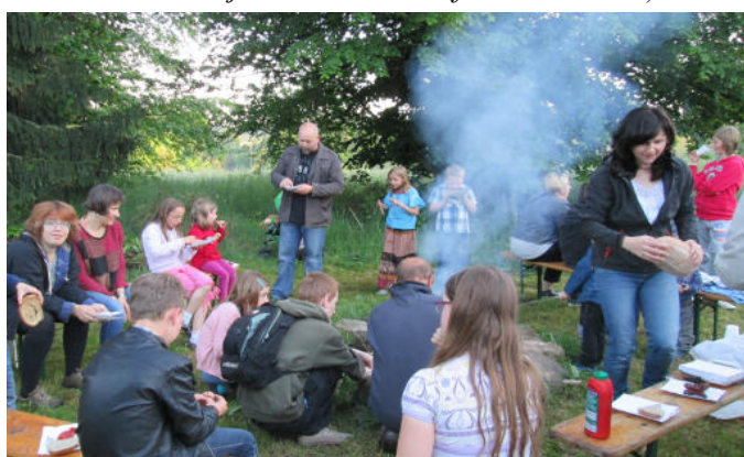
Noc kostelů na evang. fáře a kapli 29.5.2015