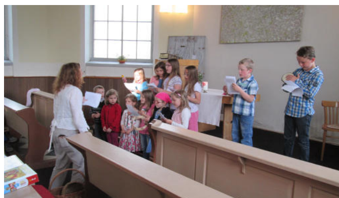
Noc kostelů na evang. fáře a kapli 29.5.2015