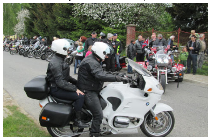
Motorkářská bohoslužba v evang. kapli