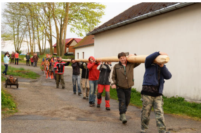
Stavění máje v České Olešné